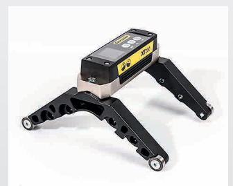
Accessori per rulli di diametro 55-800 mm. Codice 12-0901.

Easy-Laser® è prodotto da Easy-Laser AB, Alfagatan 6, SE-431 49 Mölndal, Svezia Tel +46 31 708 63 00, Fax +46 31 708 63 50, e-mail: info@easylaser.com, www.easylaser.com © 2020 Easy-Laser AB. L'azienda si riserva il diritto di introdurre modifiche senza preavviso.