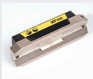
Base prismatica rettificata di precisione. Due fori per gli adattamenti personalizzati e le staffe.