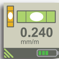
Display chiaro su XT290. Valori e grafici in tempo reale.

Allineamento con valori in tempo reale, documentazione in PDF. (App XT Alignment per iOS e Android. Programma Valori/Livello).